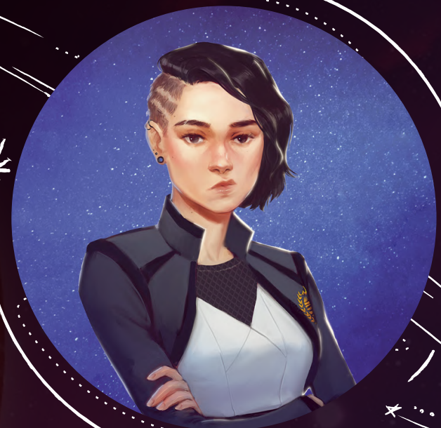
ASHA AMARTYA SERVICIO DE HADES