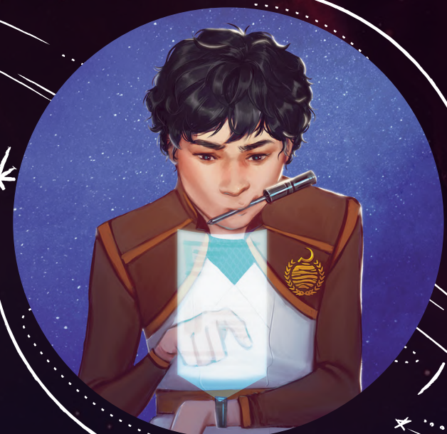
ADEN DEMIR SERVICIO DE HEFESTO