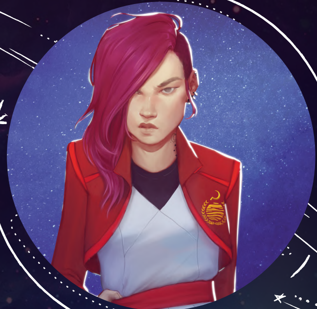
BEREN LIU SERVICIO DE ARES