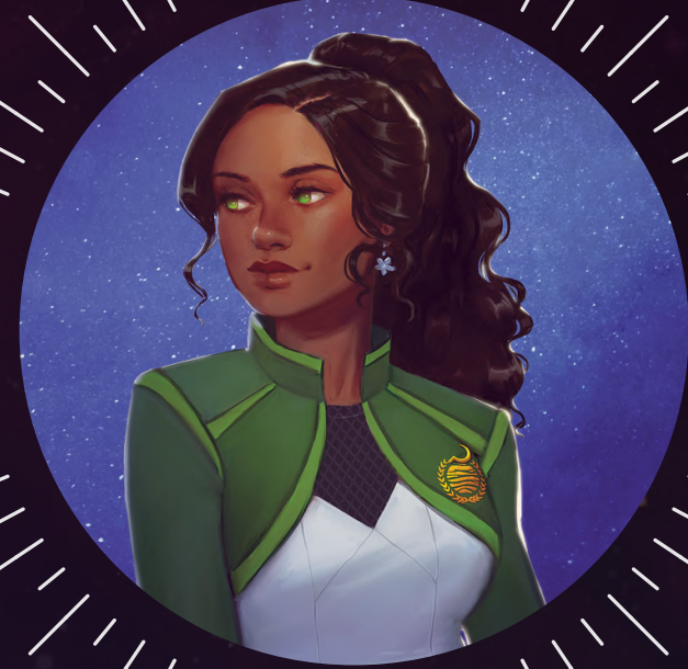
IANTHE KORE SERVICIO DE DEMÉTER