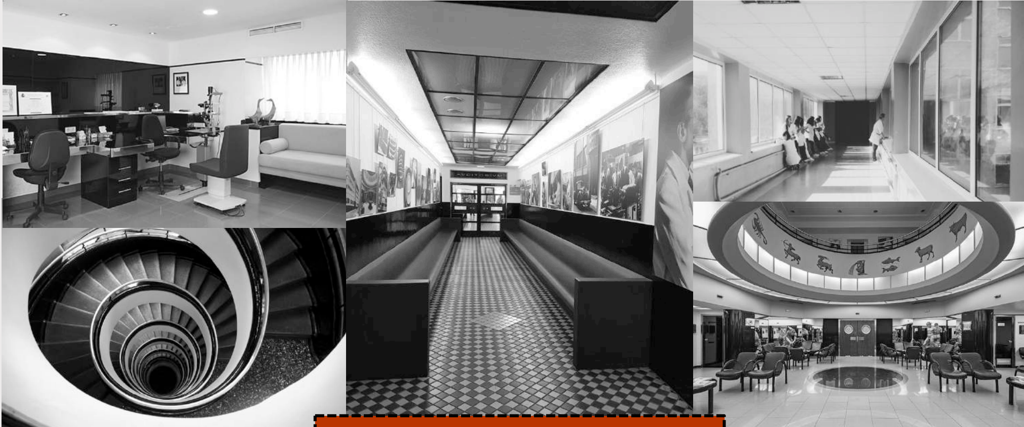
INTERIORES DE LA CLÍNICA BARRAQUER DE BARCELONA